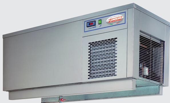
Mod. TEA 100